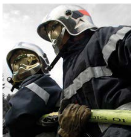
Protection civile Pompiers