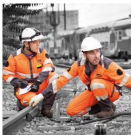
Marché Industrie EPI