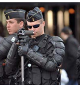
Maintien de l'ordre