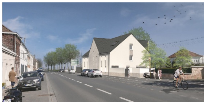
Photographies non contractuelles

L'ensemble des programmes à venir seront présentés également aux habitants et l'information sera portée à connaissance via les supports de communication de la Ville.