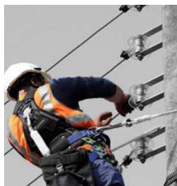
Marché Industrie EPI