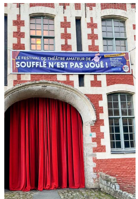
Image créée avec l'aide de l'intelligence artificielle.

www.helloasso.com/associations/souffle-n-est-pas-joue